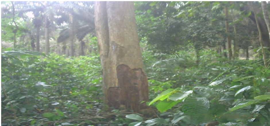
Photo n°1 : prélèvement d'écorces d'espèce végétale au jardin botanique

Les populations riveraines s'infiltrent dans le jardin pour prélever les écorces, les racines et les feuilles des espèces végétales à des fins médicinales et commerciales comme l'annonce la photo 1.